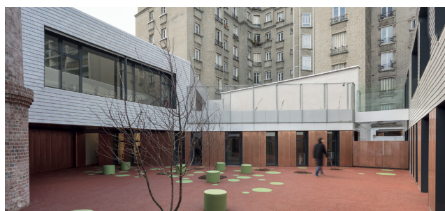
Un lieu dédié à la parentalité

Le pôle Petite Enfance | 3 centres de Protection Maternelle Infantile (PMI), un Relais d'Auxiliaires Parentales (RAP) et plus de 30 structures d'accueil de jeunes enfants à Paris dont la Villa Vauvenargues .